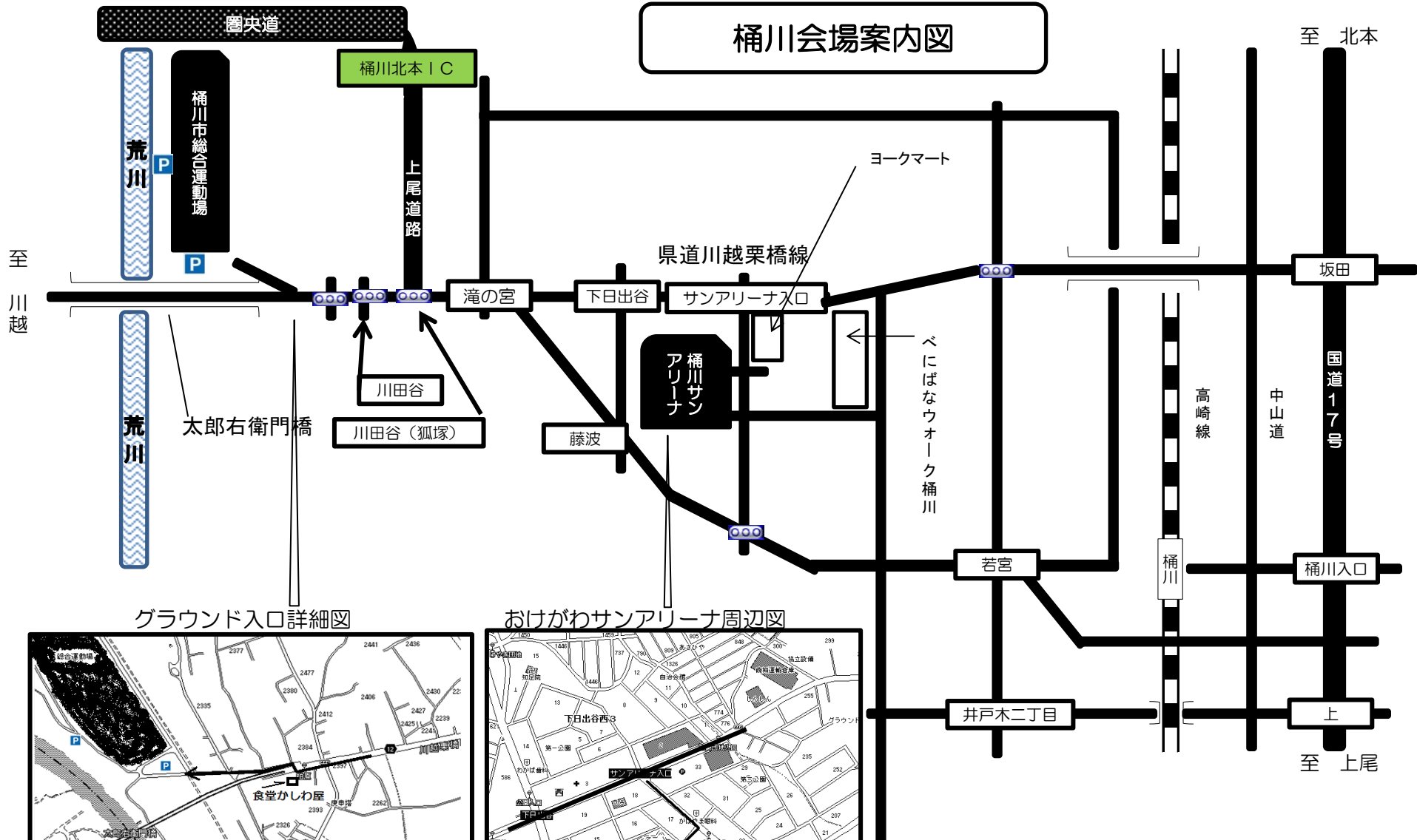
グラウンド入口詳細図